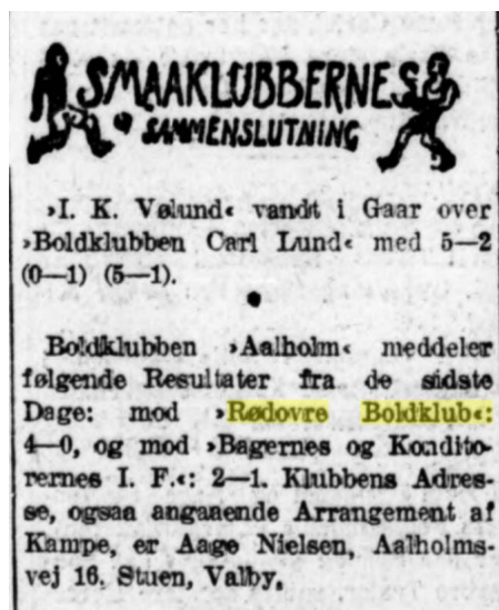
Social-Demokraten, 29. juli 1926.

på. Grundlæggende har arkiverdenen været struktureret ud fra et princip om proveniens (dvs. hvor materialet kommet fra), eventuelt klassificeret i overordnede kategorier såsom emner, personer og begivenheder – og ud fra disse principper er materialet blevet puttet i kasser; det gjorde det muligt at finde det igen. Hvis man eksempelvis ville vide noget om fodbold i Rødovre i 1920'erne, ville det største held være, at der eksisterede en kasse fra en fodboldklub fra det sted og den periode. Ellers måtte man prøve sig frem i nærliggende eller overordnede kategorier, f.eks. fodboldklubber i Hvidovre eller idrætsforeninger i Rødovre. Jo bedre materialet er beskrevet, jo større sandsynlighed er der for at kunne finde det igen.