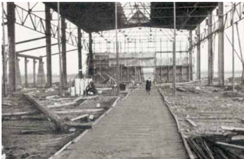
Fabrikken i Hvissinge under opførelse. 1938

Firmaet havde scoret nogle vigtige points. Det var omkring dette tidspunkt, at man begyndte at lave bogtrykkermetal. Det gav både tekniske problemer og mange reklamationer, men efterhånden blev produktet bedre, og der kom flere kunder.