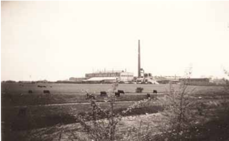
Græssende kvæg på Kroghslysts marker med Bergsøes fabrik bagest. Ca. 1950