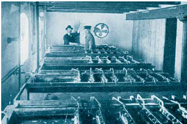
Fabrikken på Bülowvej: elektrolysekar med elektroder, 1903

giver adgang til et godt job holder ikke, hverken før eller nu.