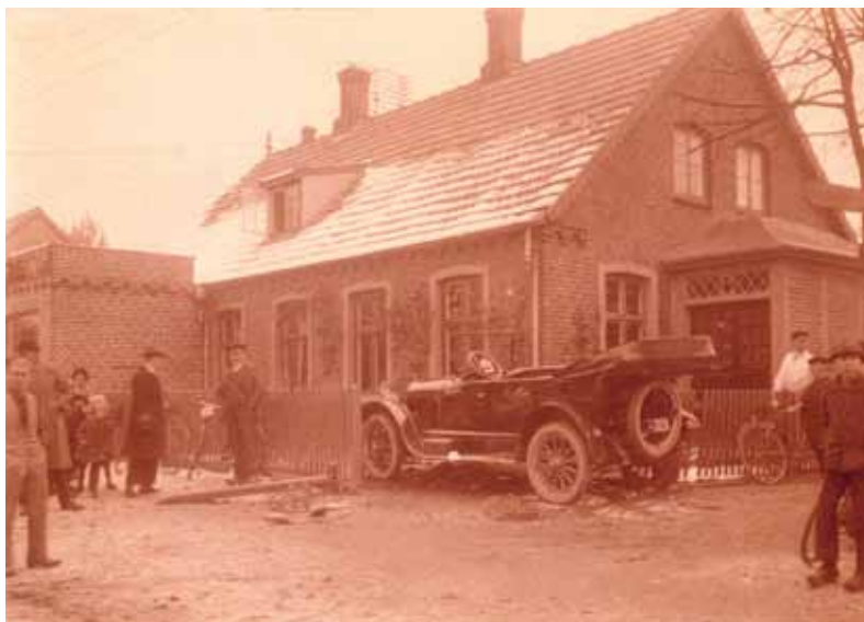
Hovedvejen 107. Bemærk veteranbilen med nedrullet kaleche. Ca. 1930

Henning Lundemann: Emil Sanders bageri (Hovedvejen 109). Ca. 1930. 2 fotos. Glostrup Bryggeri. 1922. 6 fotos. Sunlight (sæbefabrik) med observationsposten på taget. Ca. 1942. 4 fotos. Børnehjælpsdag med Søndre Birks Politiorkester på Nørre Allé. 1955. Foto. Fagenes Fest på Hovedvejen. Ca. 1955. 3 fotos. Østervej 2 (skomagerhuset). Ca. 1955. Foto. Jernbanevej (set fra Glostrupcentrets tagparkering). Ca. 1975. Foto. Glostrup Apotek. Ca. 1955. Foto.