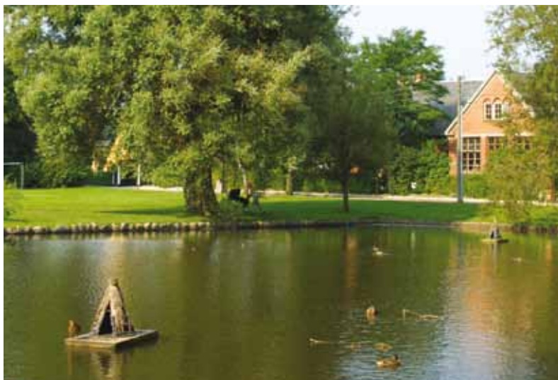
I vor tid er gadekæret en dejlig, rekreativ oase. 31. juli 2002