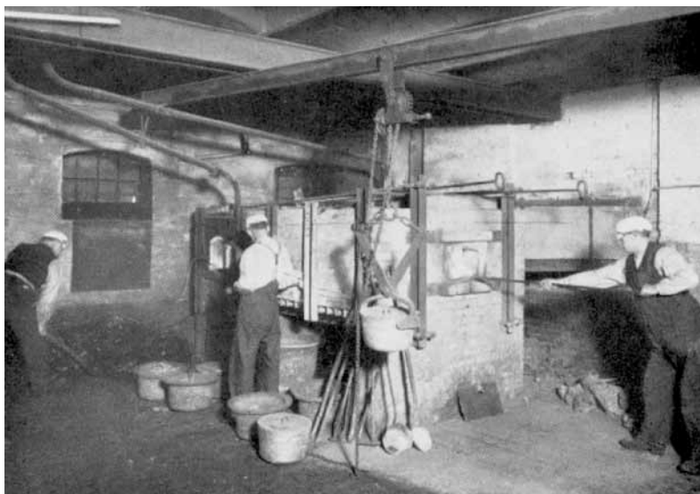
Fabrikken: den gamle blyovn i kælderen på Bülowvej. 1922