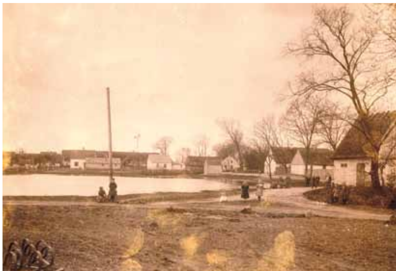
Der ser idyllisk ud ved gadekæret. Men livet var hårdt for de fleste. Ca. 1905

Det sidste foto viser bygningen i dag. Efter 1950 har huset været anvendt af private virksomheder.