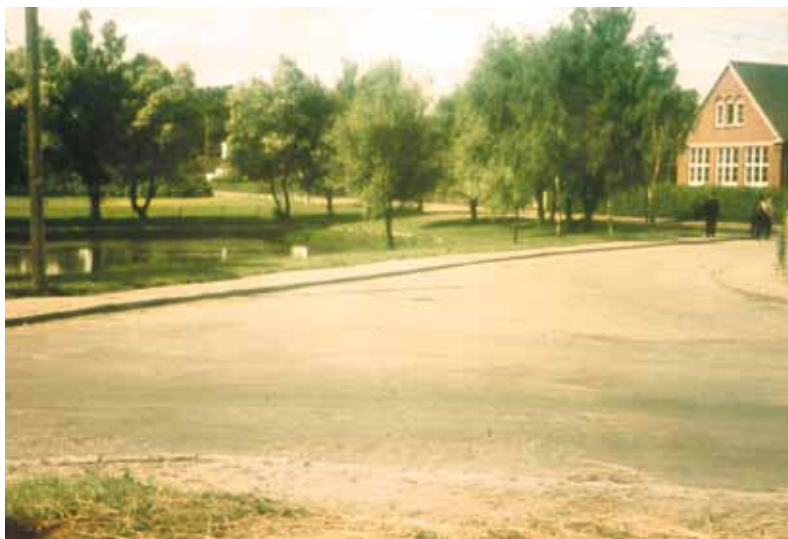
Under krigen gik livet næsten sin vante gang her ude på landet. 17. juli 1944