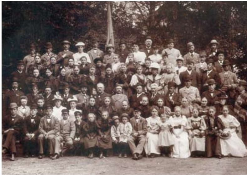
Glostrup Sangforening samlede mange mennesker. Her på tur til Dyrehaven, 1893

I 1866 blev Glostrup Bys Sygekasse oprettet, og man kan sige, at udviklingen nu begyndte at blive synlig. Man manglede faktisk blot et forsamlingshus for at få et velfungerende fællesskab.