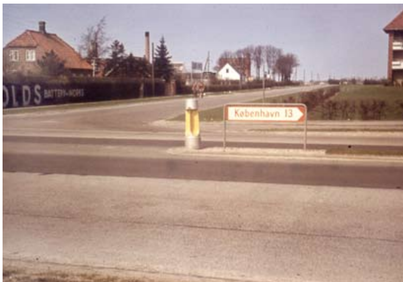
Herstedøstervej endnu med batterifabrik. Til højre en moderne ejendom, 1959