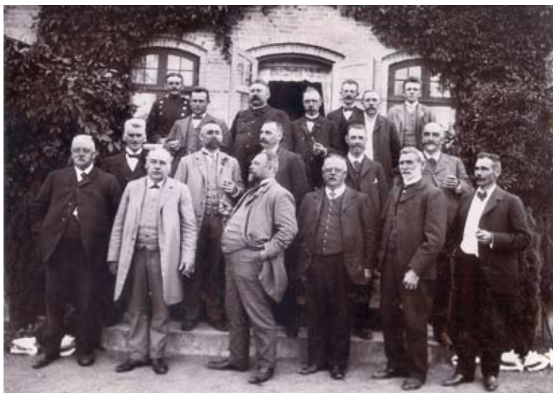
Sådan så tidens magtfulde mænd typisk ud langt ind i 20. århundrede, ca. 1915

De nye råd havde meget lidt med demokrati at gøre. Reglerne sikrede, at sognets mest velhavende mænd fik afgørende indflydelse på alle beslutninger. Man kan sige, at magtens mænd nu fik en officiel blåstempling af den magt, som de altid havde haft.