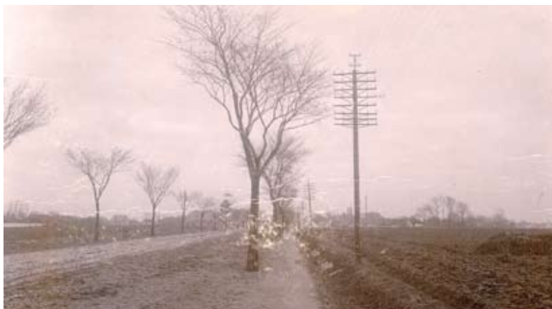
Hovedvejen (Roskilde Landevej). Bemærk elmasterne til højre. Set mod øst, ca. 1890

De fleste lokalhistoriske artikler handler om den nyere tid, dvs. de sidste ca. 100 år. Jeg synes derfor, at det kunne være interessant at se nærmere på det Glostrup, som forsvandt med industrialiseringen og urbaniseringen dengang. Hvordan så der ud, og hvilken udvikling var der i Glostrup fra ca. 1850 til 1880. Det viser sig, at der faktisk skete en hel del.