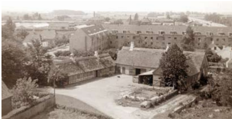
Vestlige Bryggergård med Ringgården (opført 1934) bagved. Set mod vest, 1942

På den sydlige side af Roskilde Landevej lå de to såkaldte bryggergårde. Bryggergård 1 (vestlige) lå på Bryggergårdsvej, lige bag den senere biograf. Gården havde 66 tønder land mellem Vestervej og Herstedøstervej.