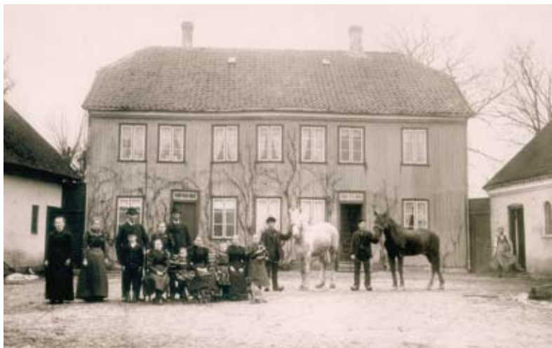
Glostrupgård. Familie og folkehold på gårdspladsen. Bemærk de to etager, ca. 1895

En gård af særlig karakter lå for enden af Østervej. Dens navn var Glostrupgård, og navnet alene viser dens betydning. Til gården hørte 45 tønder land, som lå på det senere hospitalsområde og den nordlige del af Sportsvejområdet. Gårdens fornemme præg viser sig ved ejernes titler. Her var ikke tale om bønder i almindelig forstand. Indehaverne var bl.a. en kammerjunker og en overkrigskommissær.