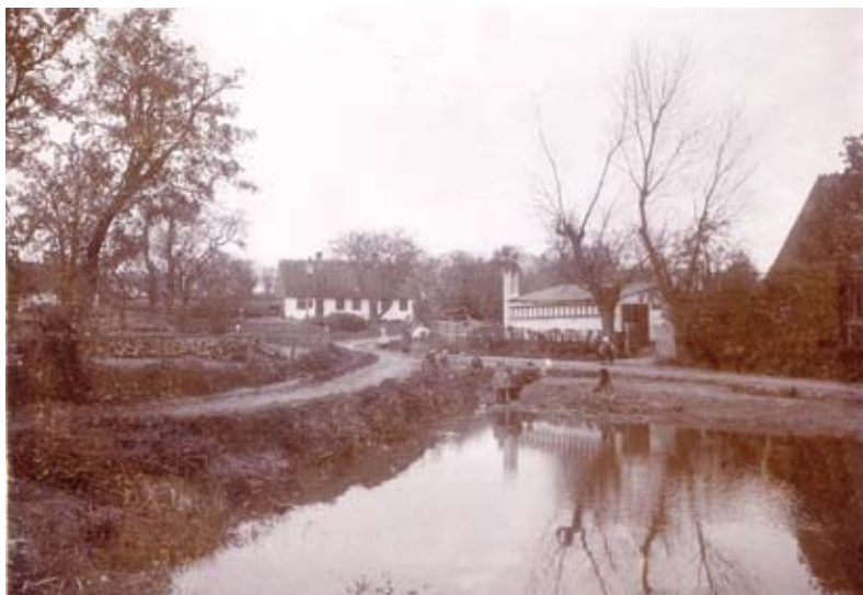
Glostrup Gadekær ved Vestervej, som ses til højre. Set mod nordøst, ca. 1906

Foruden vejforbindelser til nabolandsbyerne havde Glostrup her midt i 1800-tallet selvfølgelig også veje til den lokale trafik.