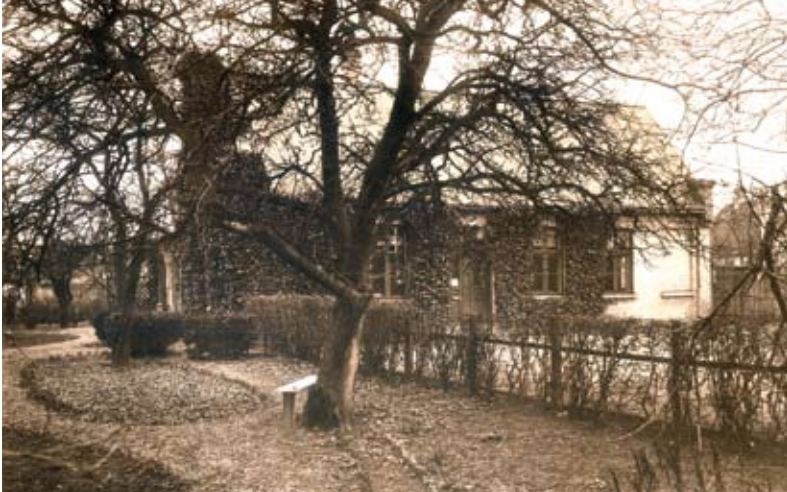
Den gamle landsbyskole på Østervej 9 var 1902-1927 kommunekontor, ca. 1924

Netop med begrundelse i dette forhold havde sogneforstanderskabet i 1863 ansøgt og fået tilladelse til at udleje nogle kirke- og degnejorder i Glostrup. Aftalen med Københavns Amts Skoledirektion var, at de indkomne penge efter fem års opsparing skulle anvendes til opførelse af en skole i landsbyen.