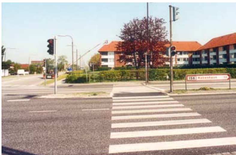
Herstedøstervej har fået lyssignal mod Hovedvejen, 9. maj 1994