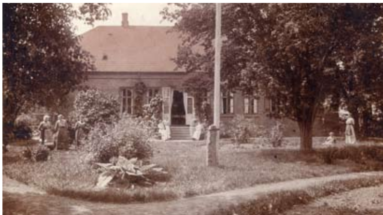
Det tidligere apotek på Hovedvejen 179. Her som plejehjemmet Eben-Ezer, 1910