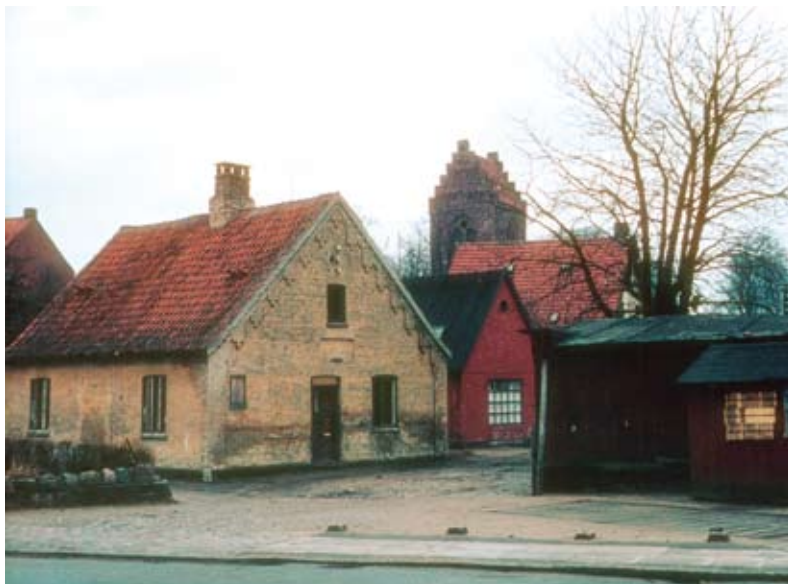
Fattighuset ved Vestervej og Mellemvej. Bagest kirken. Set mod nordøst, ca. 1961

Den fattige kunne nu få tag over hovedet, og skikken med at gå på omgang forsvandt næsten i løbet af 1860'erne. Fattighuset selv eksisterede i over 100 år. Det blev nedrevet ca. 1965, da Kvickly-bygningen skulle opføres.