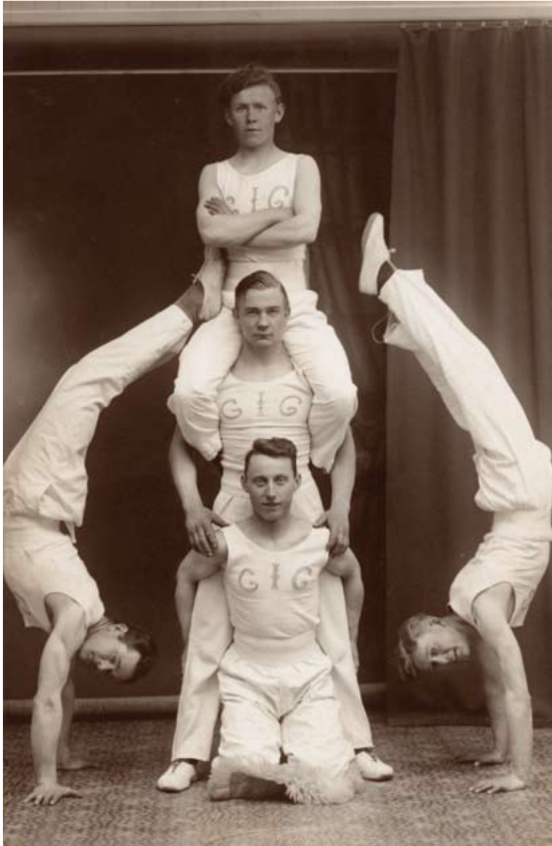
Billedet af elitegymnasterne er venligst udlånt af Anna Lise Barth