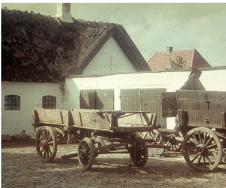
Erdalsgården (Hovedvejen 60). Gårdsplads og arbejdsvogn, 12. september, 1943

De østligste dele af præstegårdsjorden blev solgt fra til Erdalsgården (Hovedvejen 60), og i 1903 solgtes de nordlige dele af jorderne fra til Rønnebjerggård (Egevej 6).