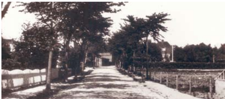
Kildevældets Allé. Bryggerens store privatvilla ses til højre. Set mod nord, ca. 1925

Gadekæret findes ikke længere, men højt op i 20. århundrede kunne det let lokaliseres. Til vanding af kvæg og lignende anvendtes ikke kæret. Det gjorde til gengæld kildevældet ved det nuværende bibliotek. Dertil kom man ad Glostrup Gade (Kildevældets Allé), som var den centrale forbindelse.