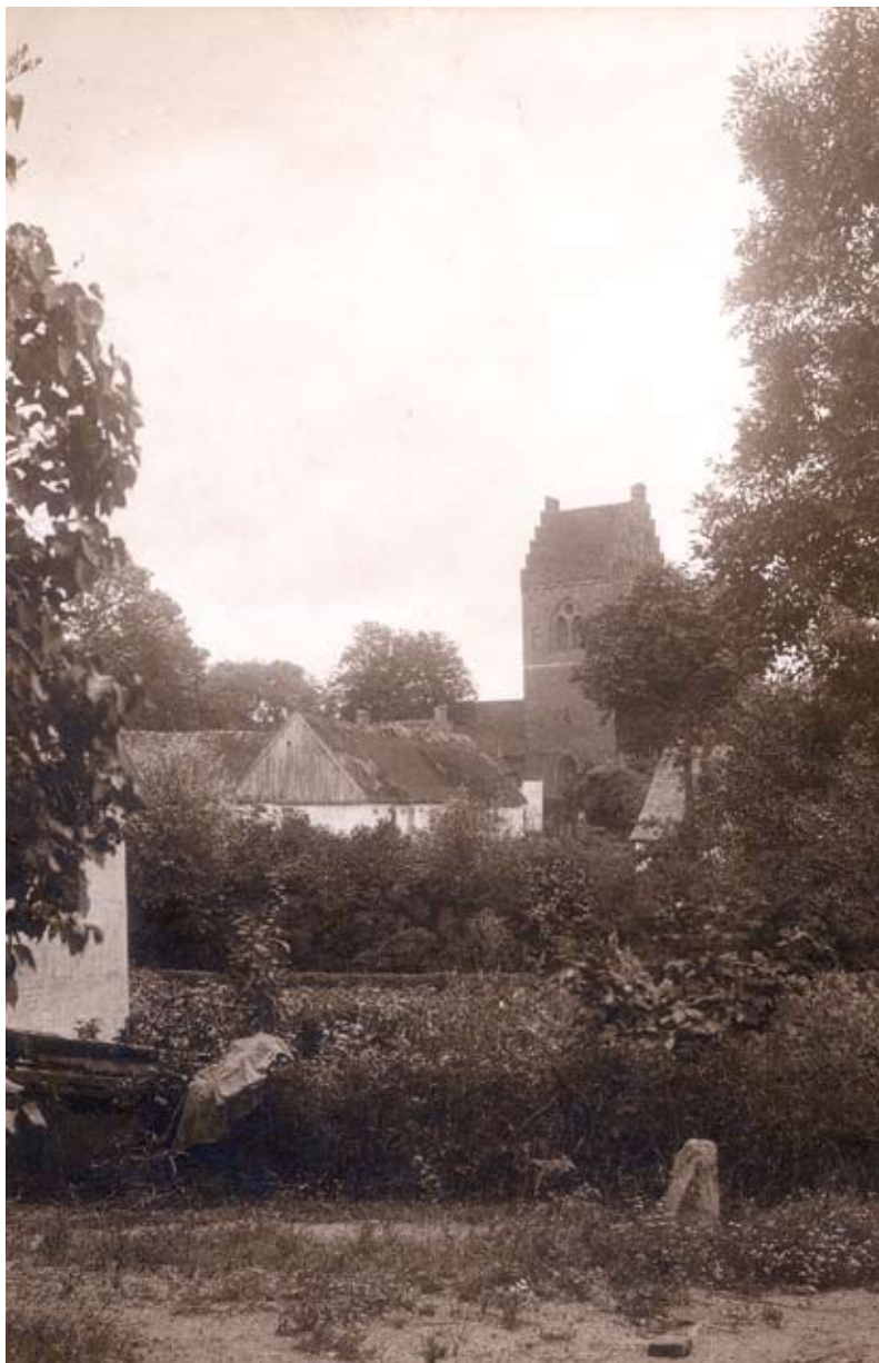
Kirkebakkegård umiddelbart nord for kirken. Set fra Kochsvej mod sydøst, ca. 1902