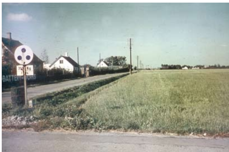
Herstedøstervej med batterifabrik, huse og efterårsmark, 10. oktober 1943

Bemærk også det gamle bivejsskilt med de tre prikker på det første foto, hellen på det næste og endelig lyssignalet på det sidste. Herude i den østligste ende af Glostrup blev den gamle landbokultur bevaret længere end i det centrale Glostrup.