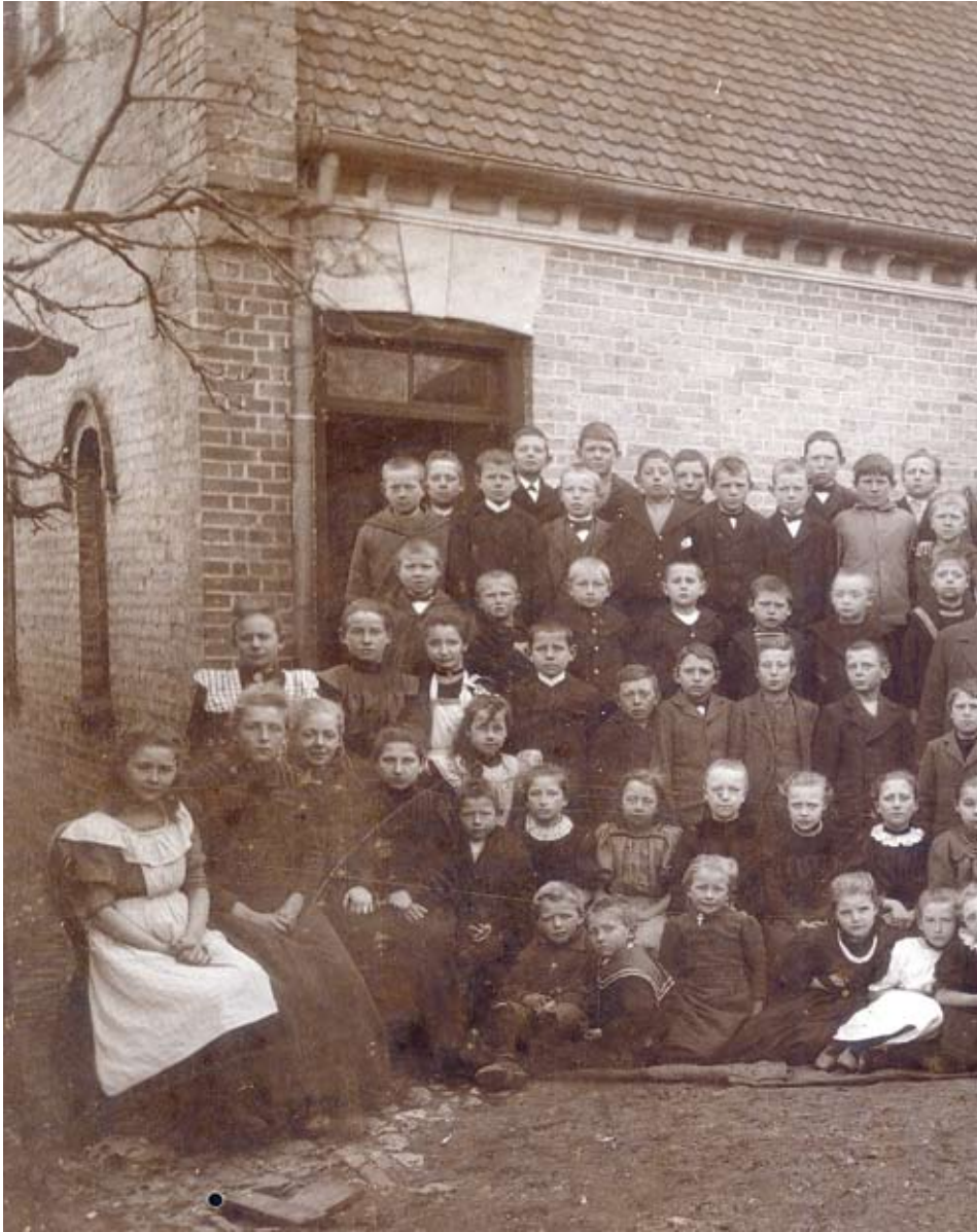
Glostrups første skole (opført 1876) blev i 1902 afløst af Højvangskolen.