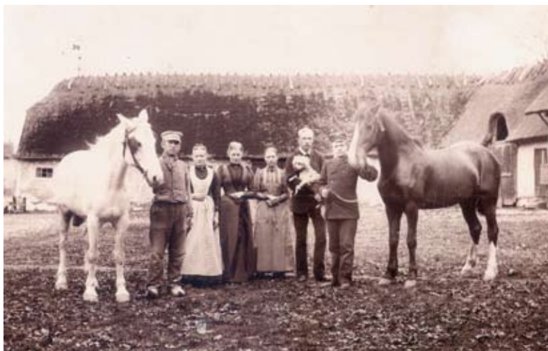
Glostrup Præstegård før den store brand i 1905. Folk på gårdspladsen, ca. 1892

Præstegården var landsbyens største gård. Her boede præsten, som nød en ganske særlig respekt. Han havde 93 tønder land til sin rådighed, og markerne strakte sig fra kirken til Vestvolden og fra Hovedvejen til Solvangsparken. Senere blev en del af jorden dog solgt fra til nye gårde.