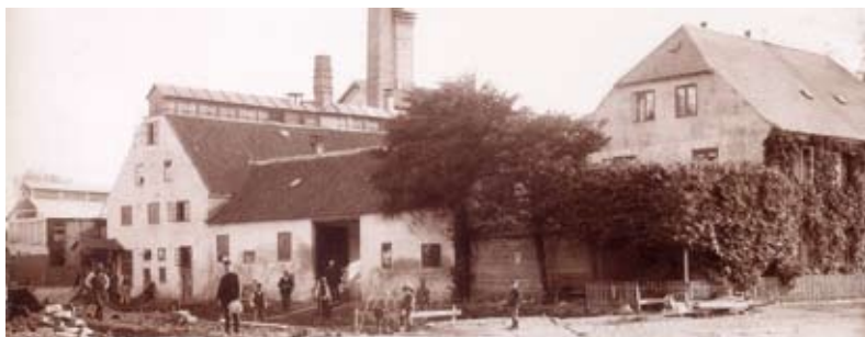
Glostrup Bryggeri (opført 1847) før udvidelsen. Fra Hovedvejen mod sydvest, 1890

I Glostrup landsby boede i 1850 i alt 275 mennesker. Det var ikke imponerende, for nabolandsbyerne var alle større. Det var de samme gamle otte gårde, som dominerede landsbyen, og de lå pga. den såkaldte stjerneudskiftning stadig på samme sted. På en måde kan det siges, at meget var ved det gamle.