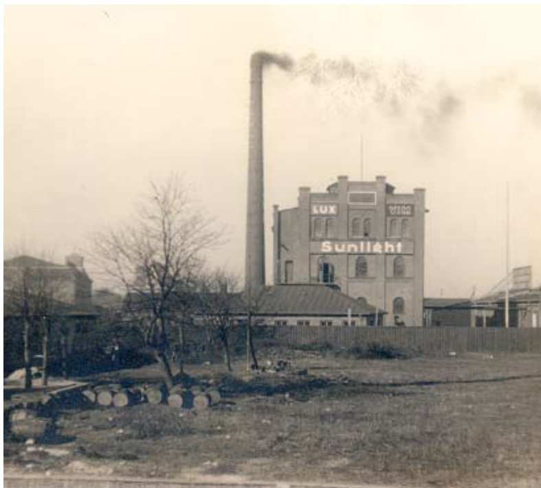
Else Rong-Poulsen har venligst doneret foto af sæbefabrikken Sunlight

Else Rong-Poulsen: Sunlight (sæbefabrik), ca. 1940. Foto. Østbrovej, ca. 1940. Foto.