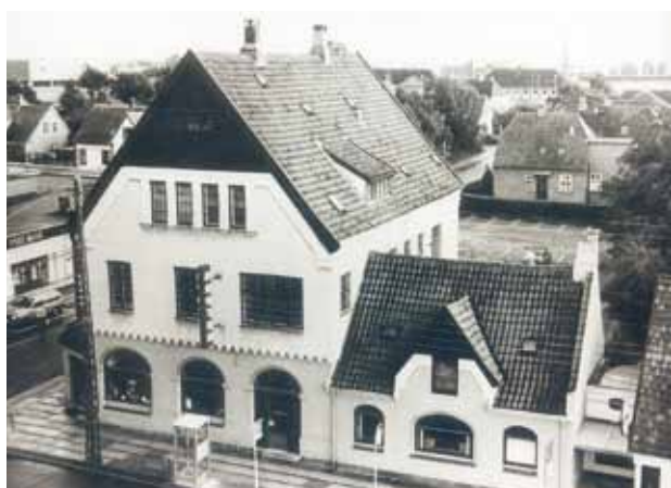
Bag apoteket ses Solvej og lidt af Vinkelvej, 12. september 1984

Der måtte gøres noget hurtigt, og et andragende om lov til at nedlægge privatboligen til fordel for apoteksvirksomheden blev afsendt. Det blev imødekommet, og allerede i 1965 var hele bygningen inddraget til egentlig apoteksvirksomhed. De nye muligheder blev bl.a. udnyttet til udvidelser i ekspeditionen, og de forbedrede forhold for publikum fik kritikken i den lokale presse til at forstumme.