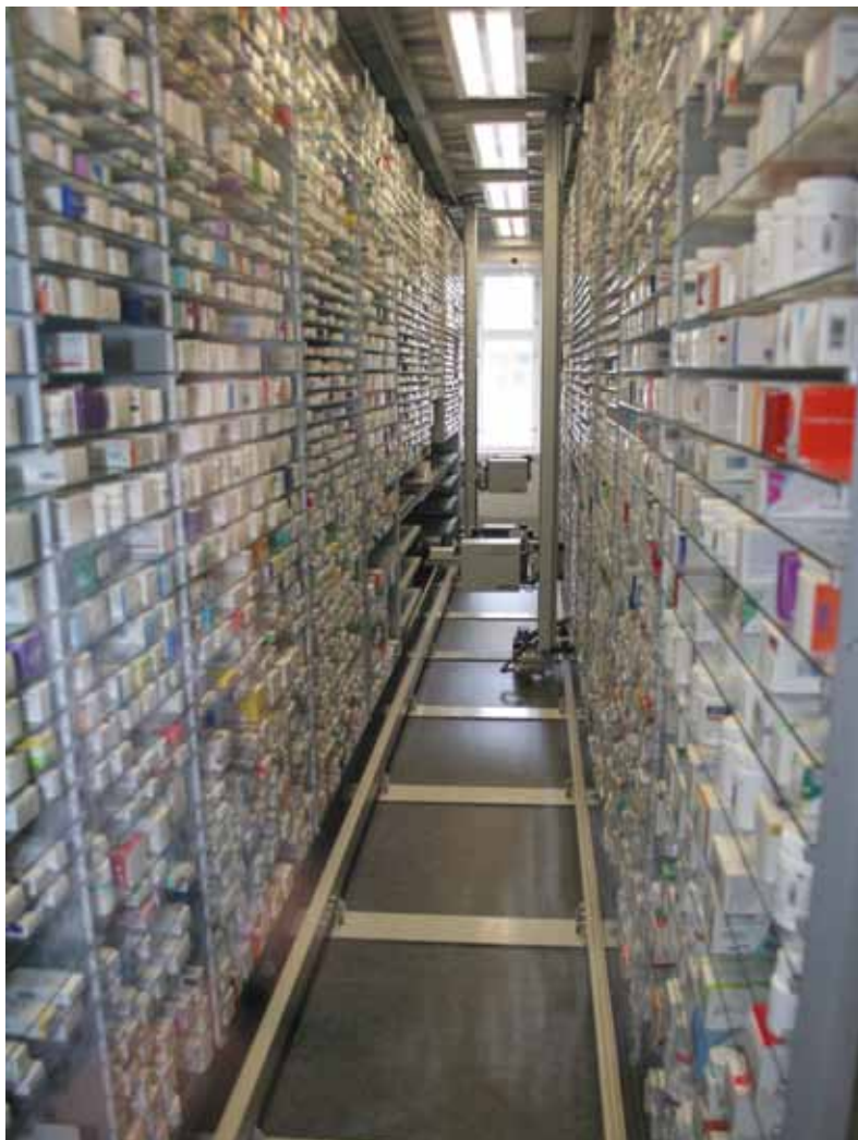
Glostrup Apotek er med på det nyeste: Her arbejder robotterne, 10. juni 2008

To robotter på første sal styrer og ekspederer fra lageret, og edb-maskiner er selvfølgelig placeret alle nødvendige steder.