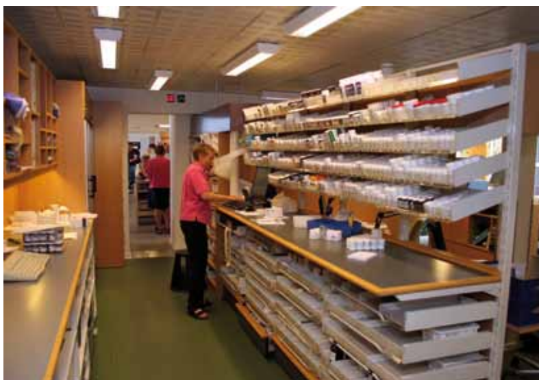
Der er travlhed i lokalerne bag apotekets publikumsekspedition, 10. juni 2008