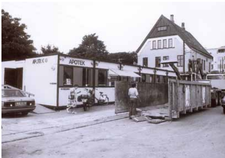
Pavilloner som ekspeditionslokaler under apotekets store renovering, 24. juni 1988