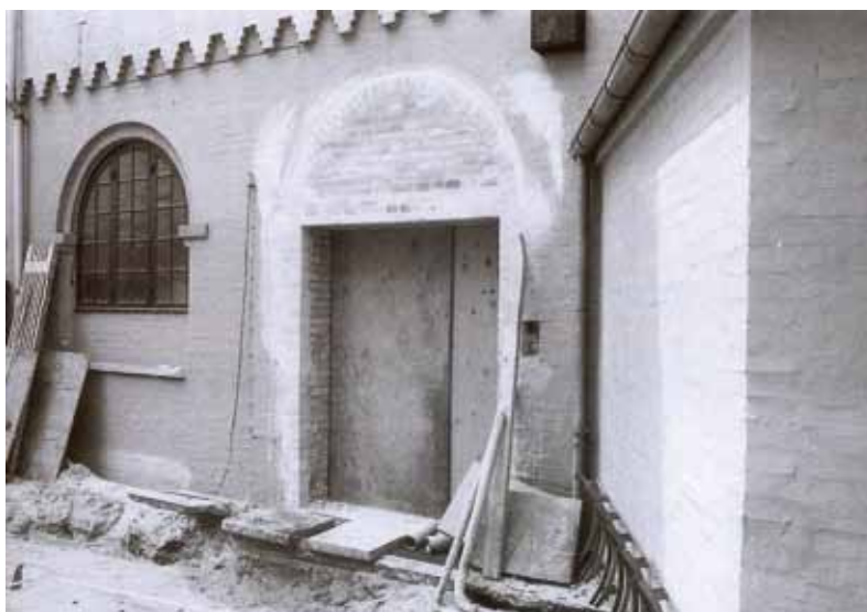
Renoveringsarbejder fandt også sted på apotekets bagside, 24. juni 1988