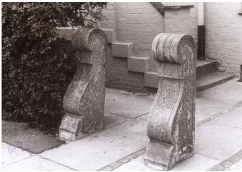
De smukke sten-opstandere stod foran den oprindelige port (se forsidefoto), 1982