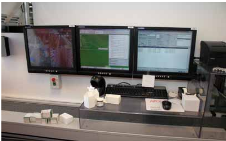
Den digitale verden har selvfølgelig også erobret Glostrup Apotek, 10. juni 2008

Den megen nye teknologi har bestemt ikke drænet virksomheden for medarbejdere. I huset er ansat ca. 40 mennesker, hvortil kommer ca. 30 på Paul Bergsøes Vej, hvor man beskæftiger sig med fremstilling af piller. Glostrup Apotek er et ud af blot to i Danmark, som endnu har bevaret den opgave. Med 70 personer ansat er Glostrup Apotek en af byens rigtig store virksomheder.