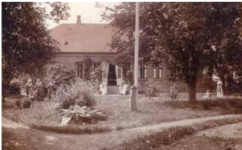
Det gamle apotek som rekreationshjem under navnet Eben-Ezer, 1910